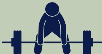
Soulevé de terre